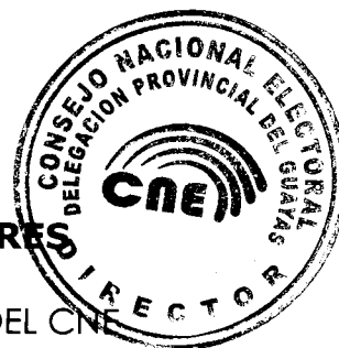
LCDA. CECILIA RODRÍGUEZ CÁCERES DIRECTORA (E) DELEGACIÓN PROVINCIAL DEL GUAYAS DEL CNE