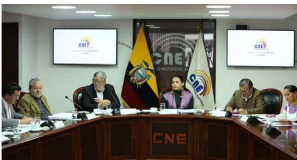
Sesión del Pleno del CNE de 8 de mayo de 2019

El CNE adoptó la Resolución CNE-PLE-3-8-5-2019, de 8 de mayo 2019, en la que se dispuso analizar las cuentas de campaña del Movimiento Político Alianza PAIS desde el año 2012 al 2016; adicionalmente, desde la Presidencia del CNE se dispuso la ampliación del período de análisis hasta el año 2017.