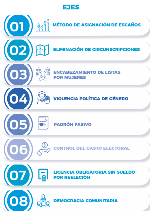
Gráfico 3. Ejes del proyecto de las reformas al Código de la Democracia