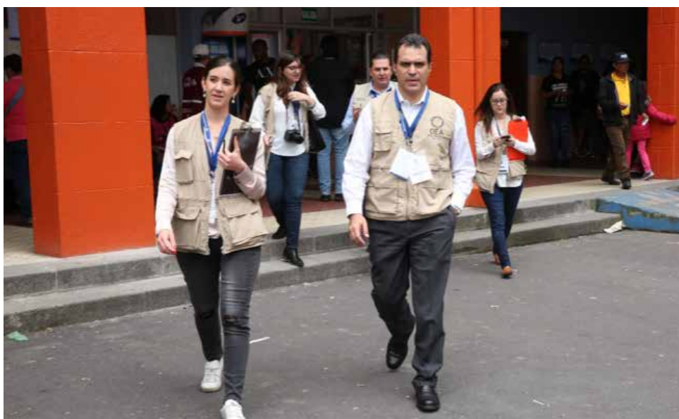
Observadores de la OEA durante recorrido por el Recinto Electoral del Colegio Sebastián de Benalcázar.

El día de la elección, los observadores internacionales recorrieron 192 recintos electorales, observando 869 Juntas Receptoras del Voto, desde su instalación hasta el conteo y transmisión de resultados. Es importante mencionar que se desplegaron observadores a 20 de las 24 provincias del país durante 4 días.