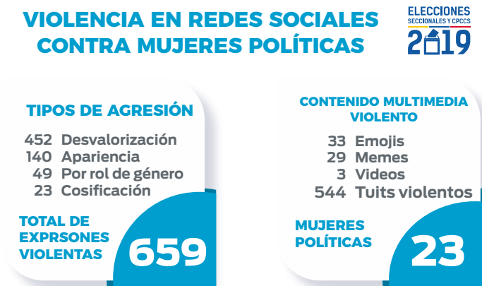
Gráfico 4. Violencia política en contra de las mujeres a través de redes sociales.