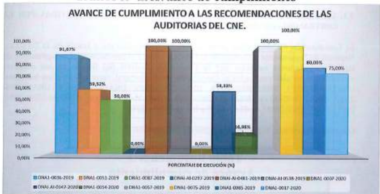
Grafico N° 1: Avance de cumplimiento